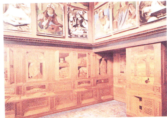
Herzog Urbino's Studiolo in Gubbio, 15. Jhdt.

Im ursprünglichen Studiolo der Renaissance waren wichtige Dinge auf engem Raum versammelt. Es war ein Zimmerchen mit Preziositäten und Raritäten von Adligen, das nur ausgewählten Gästen zugänglich war. Es war oft fensterlos, konzentrierte so die Aufmerksamkeit auf die Sammlerstücke und deren Studium. Die Objekte aus Natur, Kunst und Wissenschaft waren in Schränken geborgen und wurden erst zur Betrachtung herausgenommen.