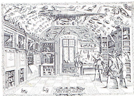
Naturalienkabinet des Ferrante Imperator, Neapel 1599

Dieses wahrnehmende Hin und Her zwischen Gegenstand, Abbildung, Gespräch und Text ist charakteristisch für die Zeit zwischen Studiolo und Wunderkammer. Im Gegensatz zum privaten Studiolo sind die Kammern und Kabinette Frühformen der Museen, wie wir sie heute kennen.